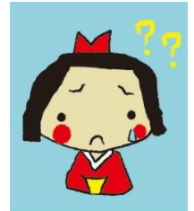
ひめまるイメージキャラクター ひめまるこちゃん

不当な勧誘・不当な契約や条項の使用・不当な広告表示に関する情報提供をお願いします。寄せられた情報は検討委員会（弁護士・司法書士・相談員で構成）で協議し、問題がある場合当該事業者に対して改善の申入れを行います。消費者被害未然防止・拡大防止のために、ぜひ「これはおかしい!」と思われる消費者トラブル情報をお寄せ下さい。